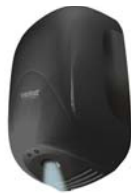
nero lucido (NF)